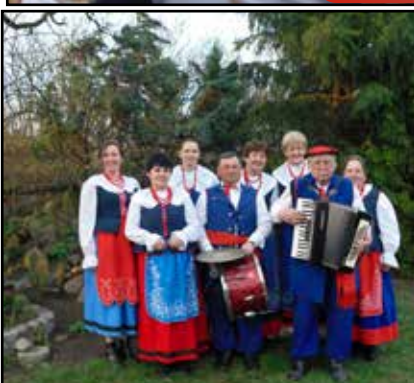
Reprezentują folklor kujawski str. nr 6