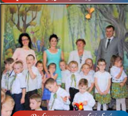
Podsumowanie działań przedszkola... str. nr 6