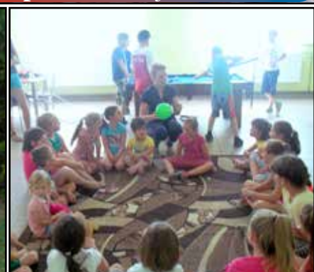
Światlice str. nr 10