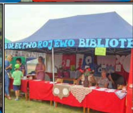
Stoisko Sołectwa Rojewo... str. nr 5