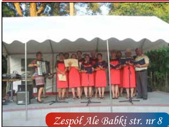
Zespół Ale Babki str. nr 8