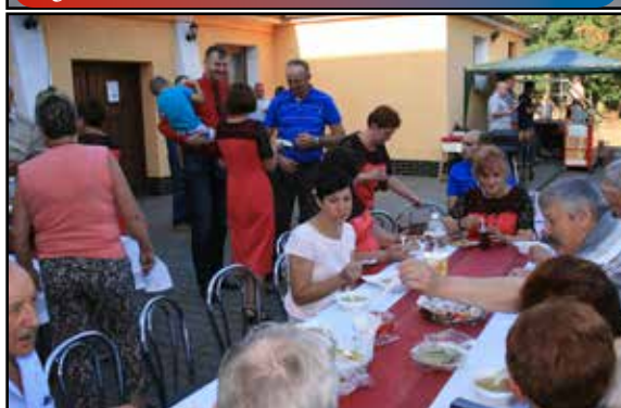
Festyn rodzinny w Rojewicach str. nr 5