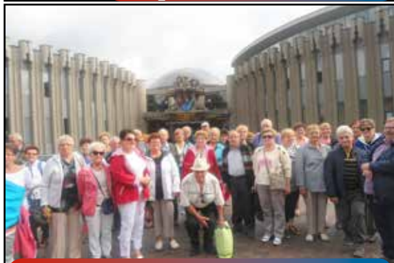
Aktywni seniorzy z wrzосу str. nr 8