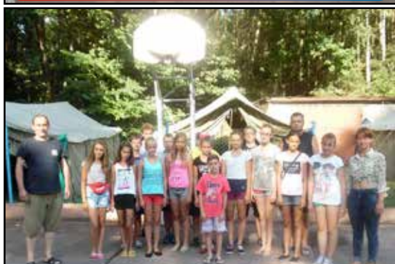
Jubileuszowe ćwiczenie... str. nr 7